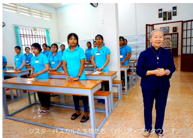
シスターバスマカルと生徒たち（バリア・フンタウ）