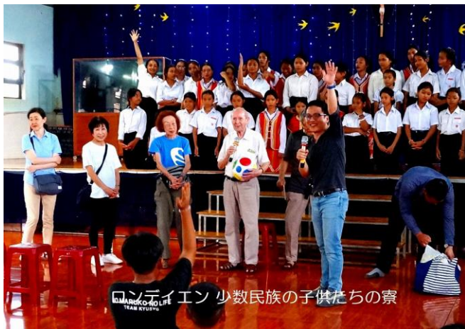
ロンディエン 少数民族の子供たちの寮